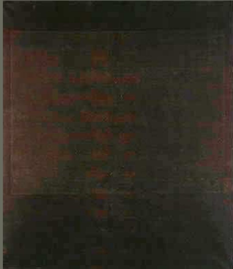
Untitled [No. 4] , 1964, National Gallery of Art, Gift of The Mark Rothko Foundation