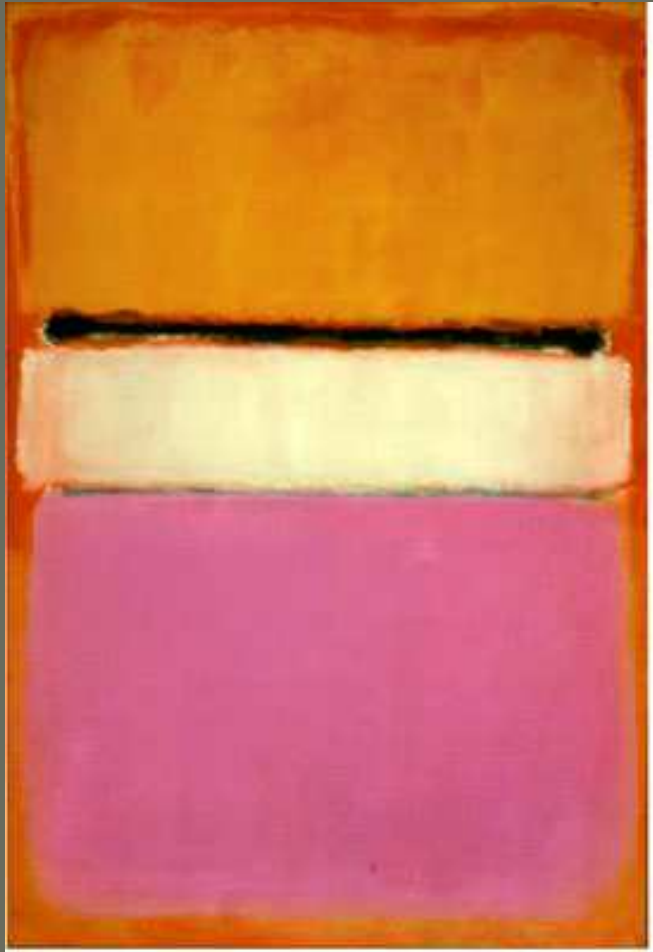
White Center , 1950, Private Collection