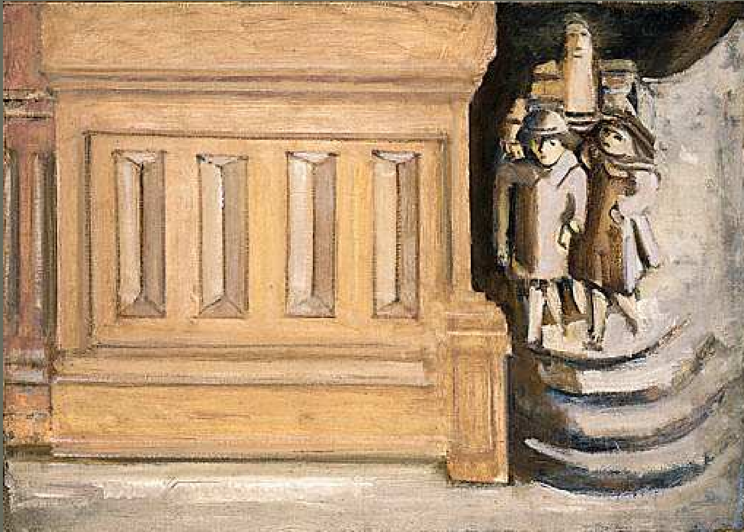
Mark Rothko, Street Scene , c. 1937, National Gallery of Art, Gift of The Mark Rothko Foundation