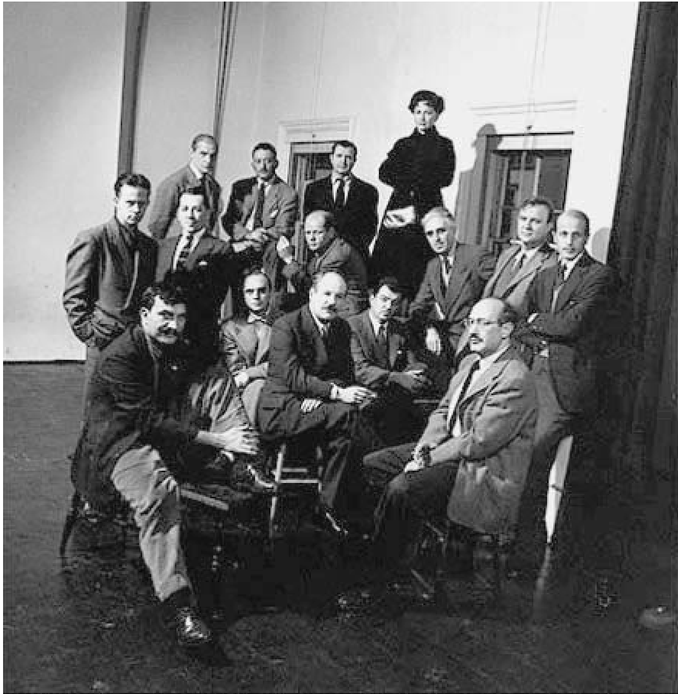
The Irascibles 1950 Life Magazine 15.1.1951